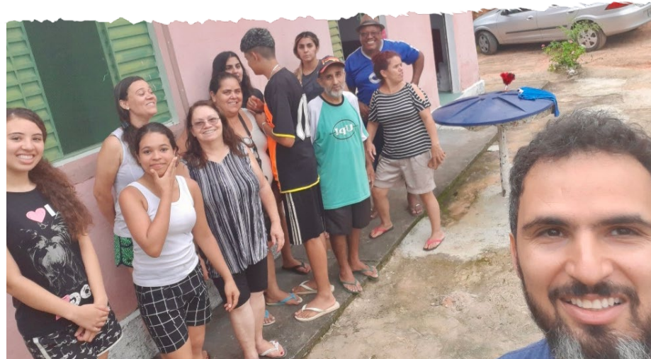
Jy het gehelp dat hierdie kerkgroep in Senador Firmino met dissipelskap opleiding kon begin. Bid saam met ons dat hierdie nuwe dissipels sal groei in hul geloof en dat hulle Christus se lig sal laat skyn in 'n wêreld wat smag na verlossing.