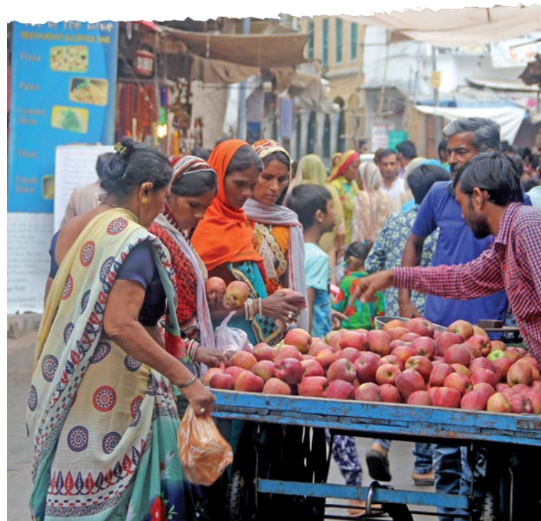
Wanneer jy hande vat met Harvesters maak jy die weg oop vir onbereiktes om Jesus te kan ken. Dankie vir jou geskenke en gebede!

“Ek verkondig die Evangelie aan diegene wat ek op straat raakloop,” verduidelik hy. “Ons vier dit deur onder die boom te aanbid.”